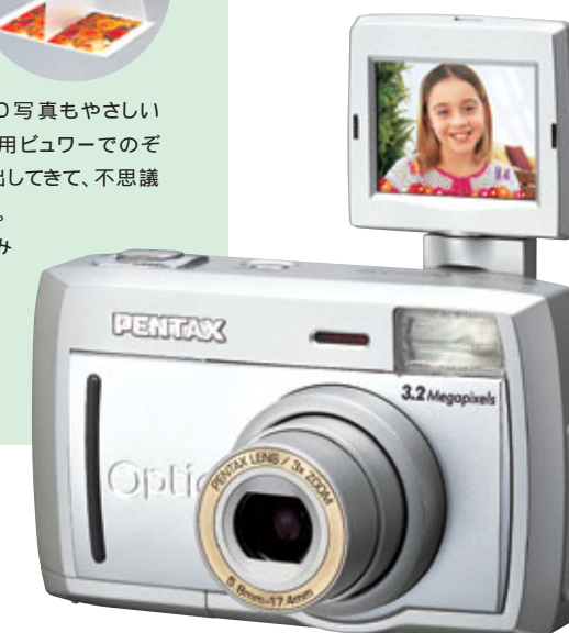
マルチアングル高画質デジタルカメラ