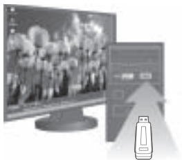
圖 1：插入 DataTraveler II Plus Migo