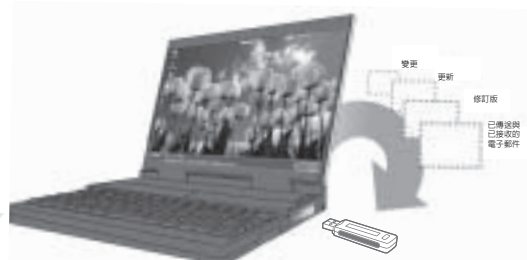
圖 5：移除 DataTraveler II Plus Migo