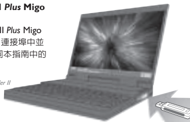
圖 3：插入 DataTraveler II Plus Migo