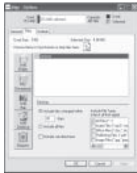
圖 2：Migo - 選項視窗

請注意：雖然檔案可能會出現於 Migo - 同步化視窗 (圖 6) 中，但是您必須先按一下「同步化」按鈕，才可以在 Migo 設定檔中使用這些檔案。