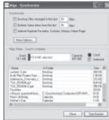
圖 6：Migo - 同步化視窗