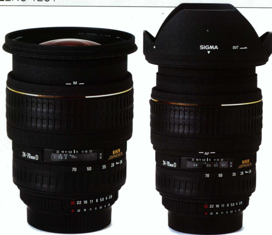
SIGMA 28-70mm，絕對是數碼AFSLR界的一大傑作！