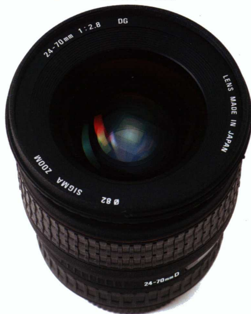
SIGMA 28-70mm f/2.8 DF,DG 鏡頭。

試以最近焦距0.4m拍攝，放大率1:3.8。再以24mm廣角拍攝影像，配合f/2.8光圈，畫面亦沒有明顯變形，認真一流！